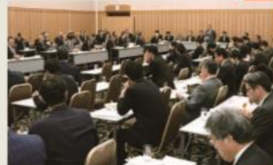
▲宅議連・全政連 合同総会でも要望（令和1年10月23日）