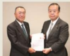
▲宮沢洋一自民党税制調査会小委員長（左）に要望（令和1年10月10日）